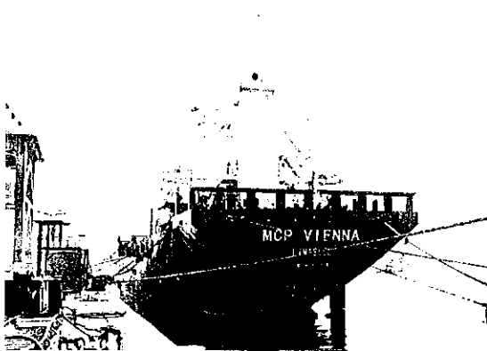
„MCP Vienna“ soll noch im April in Dienst gestellt werden

Der Österreichische Lloyd steht vor der Indienstellung des ersten von sechs neuen Mehrzweckfrachtern aus China. Die ersten drei 8000-Tonner wurden am 4. April bei Shandong Huanghai Shipbuilding in Rongcheng getauft.